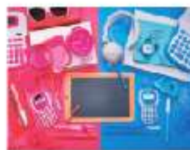
Figura 1.2 Un estereotipo frecuente en nuestra sociedad consiste en relacionar los colores rosado y azul con el género.

estereotipo. Conjunto de características asignadas a una persona por su apariencia o por pertenecer a un grupo determinado, basadas, generalmente, en prejuicios.