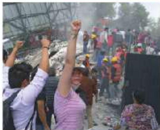
Figura 1.8 Tras el terremoto del 19 de septiembre de 2017 en México, cobró notoriedad el caso de una niña que estaba atrapada entre los escombros. La noticia resultó ser falsa.

Respondan, en grupo, a partir de los resultados de su encuesta y de la información anterior.