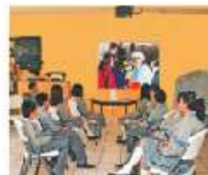
Figura 1.6 Los medios de comunicación son muy importantes para el ejercicio del derecho a la información.

Como parte de su función social, los medios de comunicación masiva deben contribuir al fortalecimiento de la integración nacional y mejorar las formas de convivencia humana, por ello deben apegarse a un código de ética basado en valores nacionales y universales, así como en los derechos humanos y la democracia.