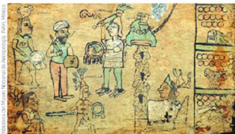
Figura 1.16 Anónimo, Códice Azoyú 2, siglo XVI. Narra la historia de los pueblos que se desarrollaron en el actual estado de Guerrero.

En parejas, observen la imagen y con base en ella, marquen con una ✓ la columna o la fila que corresponda, en la tabla siguiente.