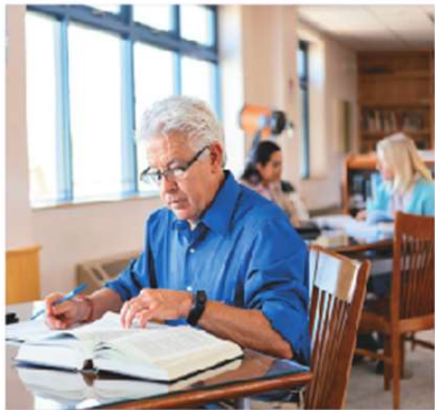
Figura 1.21 El historiador organiza e interpreta la información de las fuentes para la construcción del conocimiento histórico siguiendo una metodología.

Los historiadores que utilizan la narrativa moderna suelen decir que los relatos históricos tradicionales se centran demasiado en lo que pasó y no lo suficiente en el porqué. En cambio, los historiadores que usan la narrativa tradicional podrían decir que los relatos históricos modernos sobrecargan al lector con muchos datos.