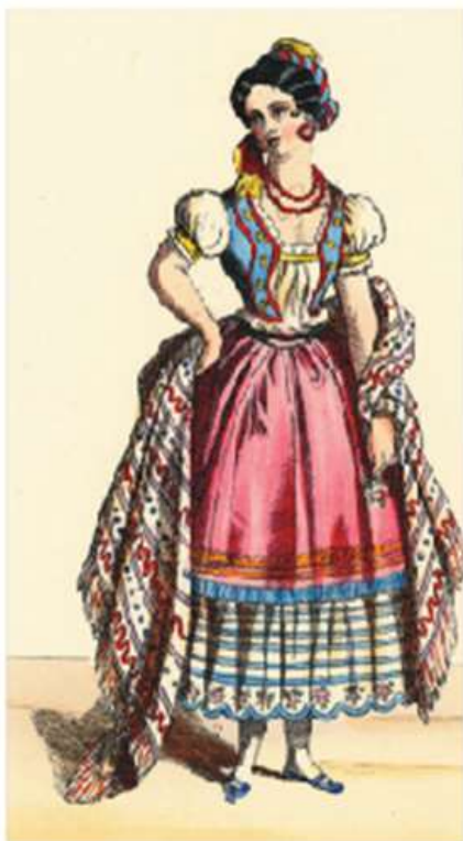
Figura 1.12 Los objetos cotidianos, como la ropa, son fuentes primarias que nos hablan de una época. Vestido de dama mexicana. Litografía de Thomas Halles Lacy, 1865.

Es tanta la variedad de fuentes a las que se puede recurrir para investigar el pasado que, por lo mismo, existen diversas maneras de clasificarlas. Los documentos, fotografías, monedas, recuerdos o vestigios familiares que se conserven se convierten en fuentes para el estudio del pasado.