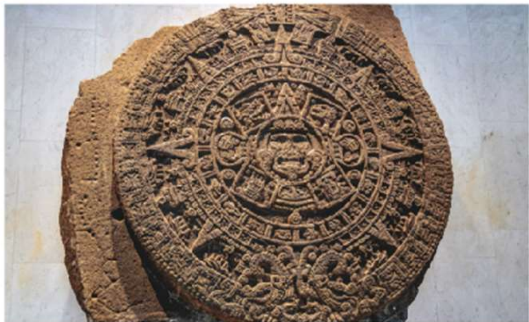
Figura 1.17 Anónimo, Piedra del sol, basalto de olivino, cultura mexicana. Museo de Antropología e Historia, Ciudad de México.