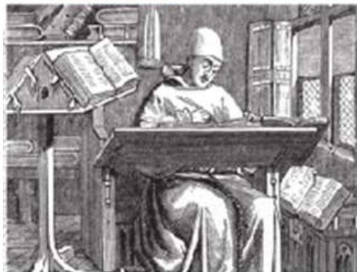
Figura 1.18 Los copistas se encargaban de reproducir libros antes de la invención de la imprenta. Escriba o copista, siglo XV. Paul Lacroix, 1870.

Ya has comprendido los diferentes tipos o clasificaciones de fuentes históricas que existen. Ahora entenderás cómo los historiadores las analizan para comprender e interpretar su contenido histórico.