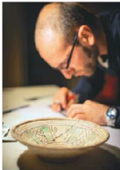
Figura 1.20 Fotografía de un arqueólogo examinando algunas vasijas antiguas.

Ahora hablaremos, en términos generales, de la metodología de análisis de fuentes, es decir, la serie de pasos para obtener conocimiento histórico de ellas (figura 1.20).