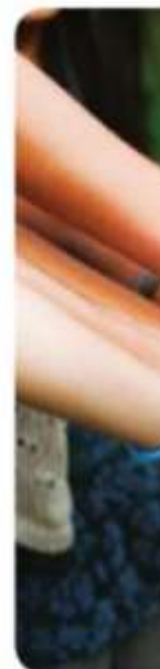
Figura 3.1 To tes, pero igu

Así, en 1948 representantes de todas las regiones del mundo realizaron en París, Francia, una Asamblea General de las Naciones Unidas en la cual se proclamó la