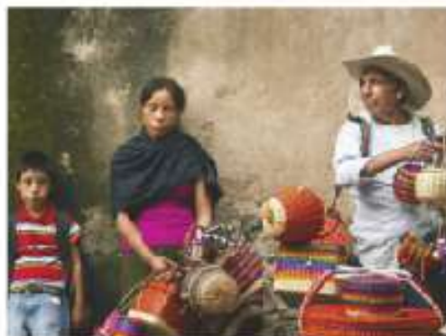
Figura 2.6 ¿Eres racista? ¿Discriminas?