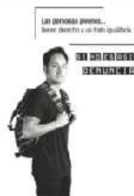
Figura 2.8 En cada entidad existe un organismo local que promueve el trato igualitario.

Además del Conapred, en México existen otras instituciones encargadas de prevenir y erradicar los distintos tipos de discriminación.