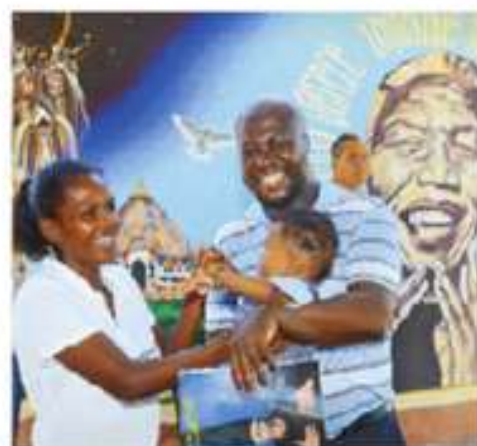
Figura 2.4 En México, los afrodescendientes han sido ignorados o negados, pero existen.

México es un país pluricultural porque en él conviven personas y pueblos de distintas culturas. La Constitución reconoce que la diversidad cultural del país se debe a que una parte importante de la población descende de los pueblos indígenas originarios y considera a los pueblos y comunidades afromexicanas parte de la composición pluricultural del país. Pero también es resultado de que, durante siglos, personas de diferentes orígenes y con distintas culturas se han mezclado, lo que da lugar a múltiples rasgos culturales. Durante la Colonia, las tres raíces que dieron lugar a la nación mexicana fueron la europea, la indígena y la africana. Además, con el correr de los años y por distintas razones, personas de varias nacionalidades decidieron venir a vivir a México y también se mezclaron. Así, podemos encontrar en la vida cotidiana y en los rasgos físicos de los mexicanos la influencia de las culturas china, árabe, estadounidense y de Latinoamérica.