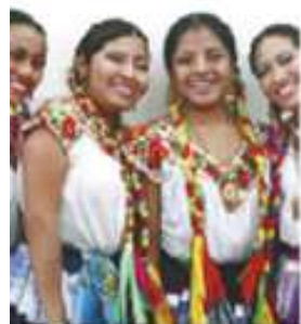
Figura 2.5 Según el Inegi, el color de la piel de los mexicanos influye en su bienestar y situación económica.

[Discriminación] de toda mi familia... desde mis abuelos, de mis papás, de mis primos, de mis tíos... más que nada de la gente grande, pero también de mis primos, luego también en broma o algo así... ay la drogadicta o la alcohólica... desde que estoy chavita nunca me han aceptado muy bien, igual porque nunca había habido una persona así en la familia ... y sí como que me huyen, como que... no me hablan... me dicen: la loca, la drogadicta.